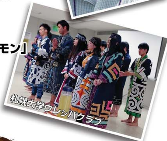
札幌大学ウレシパクラブ