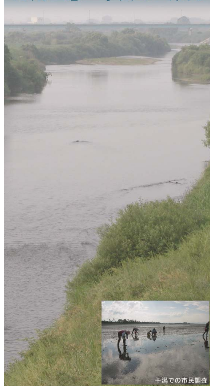
干潟での市民調査